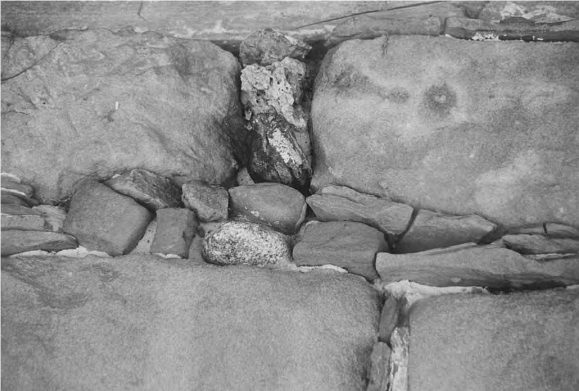
Detailansicht des Backhaus-Mauer- werks.

und neu vor dem Bauernhaus am Strässchen aufgebaut werde. Das Stöckli selber musste weichen, weil an seinem Standort eine grosse, neue Scheune erstellt werden sollte. Alle Bemühungen bei der Gemeinde Frauenkappelen und den zuständigen Fachstellen, das Backhäuschen zu erhalten, waren umsonst. Alles war bereits abgesprochen. Ein schwerfälliger Tanker der in Fahrt ist, lässt sich nicht mehr auf kurzer Strecke stoppen. Das Backhäuschen wurde abgebrochen. Man teilte mir jedoch mit, dass man gewillt sei, das neu am Strässchen aufgebaute, alte Stöckli auf einige der historischen Sandsteinquader zu stellen.