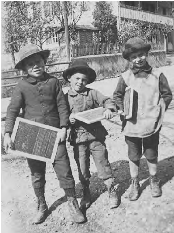
Drei Schulbuben der Unterschule Uettligen mit ihren Schiefertafeln um 1921.

Anfang des 19. Jahrhunderts war in der Gemeinde Wohlen noch vieles ganz anders als heute. Einen grossen Wandel erfuhr in dieser Zeit das Schulsystem. War bislang die Bildung der Kinder vor allem kirchlich geprägt, so wurde nun ein obligatorischer und bekenntnisunabhängiger Primarschulunterricht angestrebt. Dieses Ziel zu erreichen war ein langer und steiniger Weg!