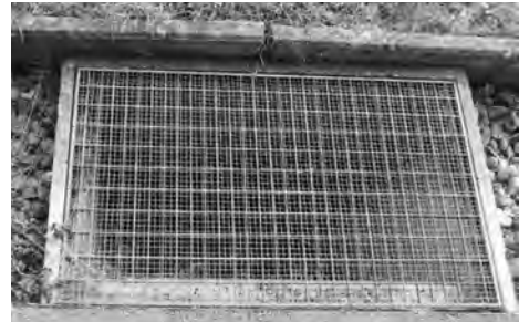
Gitterrost auf Lichtschacht mit feinem Drahtgitter abgedeckt.

Die auf der roten Liste als verletzlich eingestuft Feuersalamander leben in feuchten Laubmischwäldern, wo sie sich im Sommer paaren. Danach entwickeln sich die befruchteten Eier im Bauch der Weibchen zu Larven. Ab November überwintern