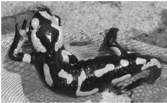
Am 1.5.2014 mit einem Netz geretteter Feuersalamander.

Jährlich verenden in unserer Gemeinde lautlos hunderte von geschützten Amphibien in Licht- und Entlüftungsschächten von Gebäuden sowie in Entwässerungsschächten und -rohren entlang von Strassen. Das ist mit ein Grund für das Schrumpfen von Amphibienpopulationen. Massnahmen sind dringend nötig. Am Wanderweg Schlossmatt-Oberdettigen wurden im Frühjahr 2014 aus zwei Schächten 16 Feuersalamander und 7 Grasfrösche gerettet. Noch dieses Jahr werden dort als Pilotprojekt Ausstiegshilfen für die Amphibien eingebaut. Helfen Sie bitte mit und decken Sie Ihre Lichtschächte mit einem feinen Gitter ab und melden Sie uns Strassenschächte mit Amphibien.