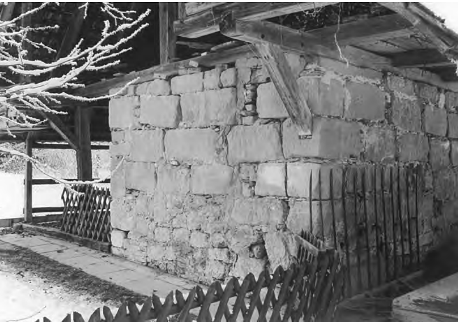
Ostseite des 2004 abgerissenen Backhauses in der Wohlei mit Sandsteinquadern von Alt-Bubenberg.

Aus bestem Sandsteinfelsen gebrochen, behauen und geformt wurden einst die Bausteine zum Schloss Alt-Bubenberg, das im Forst bei Frauenkappelen im 13. Jahrhundert hoch über der Aare (dem heutigen Wohlensee) auf einem Felsvorsprung errichtet wurde. Der Kirchenbann für Schultheiss Peter von Bubenberg und seine Nachkommen – als Strafe für den Überfall auf den Bischof von Lausanne vom Papst in Rom verhängt – hatte die Sippe Bubenberg hart getroffen. Zur Sühnung und Aufhebung des Kirchenbannes forderte der Papst die Hingabe ihres Schlosses an die Kirche und so mussten die stolzen Bubenbergs fortan im eigenen Schloss zur Miete (Lehen) leben, wie im letzten Gemeindeinfo auf Seite 24 zu lesen war.