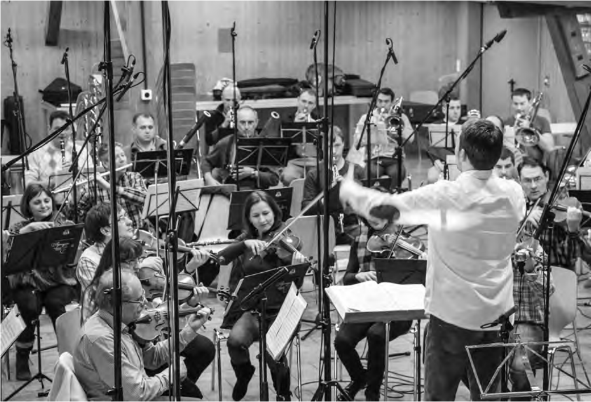
Volle Konzentration während der Aufnahmen im Kipferhaus in Hinterkappelen.