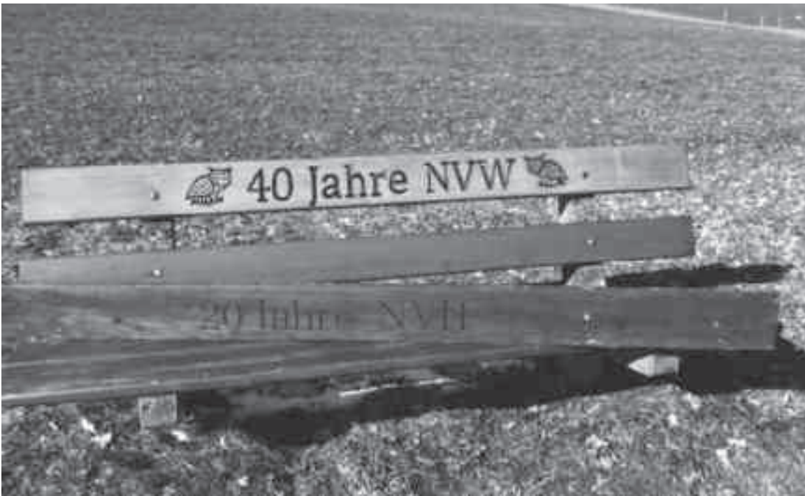
Die 20-jährige Rückenlehne wurde dieses Jahr mit dem neuen Brett «40 Jahre NVW» ersetzt.