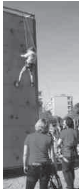
Gefahrlos das Klettern üben: Für die Kinder war die Kletterwand die Attraktion am Dorfmarkt 2013.

Die Gemeindeversammlung gibt nach längerer Diskussion grünes Licht für die Umgestaltung des Dorfplatzes in Hinterkappelen und genehmigt den Bruttokredit von 400 000 Franken. Der Anteil der Gemeinde beträgt 200 000 Franken. Einheimische Bäume in Containern sollen künftig Grün und Schatten spenden. Asphaltwege erleichtern die Begehrbarkeit mit Rollatoren, Rollstühlen oder auch Kinderwagen. Die Gemeindeversammlung gibt nach diesem Geschäft auch grünes Licht für die Anpassung des Uferschutzplanes auf dem Stucki-Areal zur Erstellung von neuem Wohnraum.