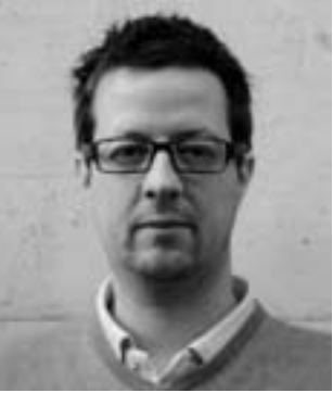
Lars Villiger (zvg.)

Sie lesen gerade das neue «Gemeindeinfo», das nach fast 12 Jahren das gewohnte, blaue «Gemeineblatt» abgelöst hat als Informationsmagazin aus der Verwaltung und zum regen Dörfer-Leben. Wie beim Ende Mai erhaltenen Jahresbericht und der Botschaft ist der Auftritt zeitgemässer, frischer und farbiger geworden. Wir hoffen, dass Ihnen die neue Gestaltung gefällt, die der Grafiker Lars Villiger entworfen hat.