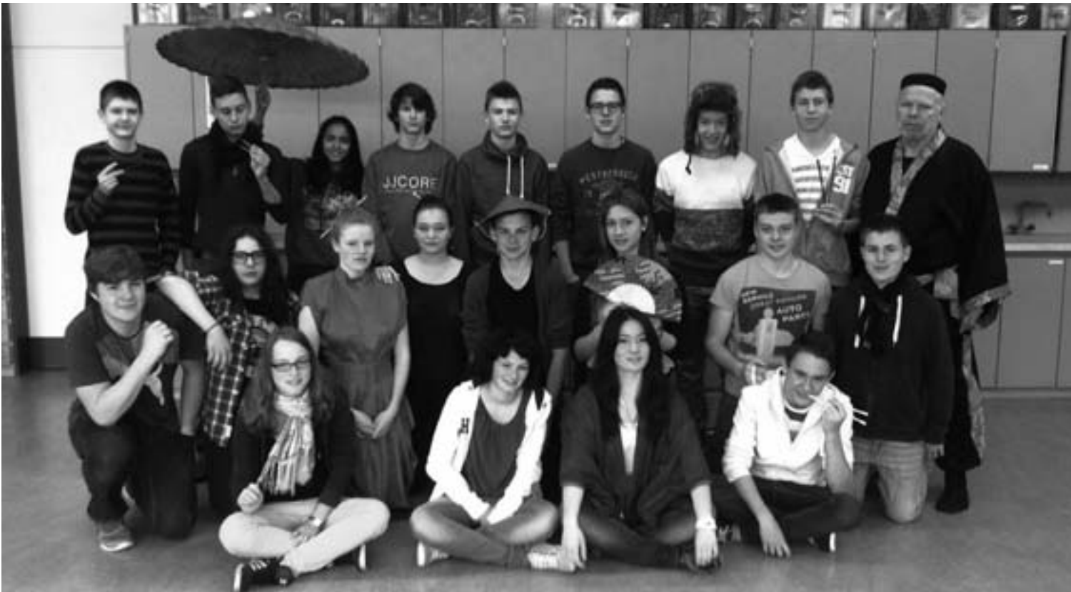
Die Klasse 9b mit ihren ersten Schritten auf dem Weg zu Turandot.

Vorverkauf: Mo. 24.–Do. 27.06., je 09.45–10.30 Uhr, in der Schule