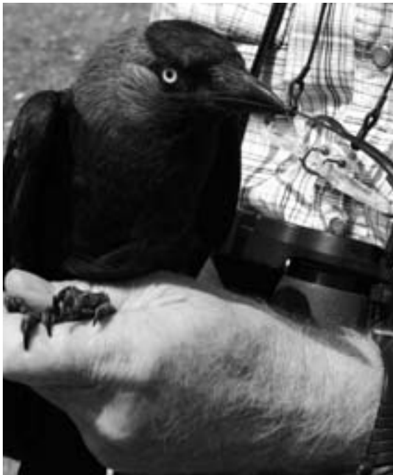
Die Turmdohle ist selten und steht auf der Roten Liste der gefährdeten Vogelarten in der Schweiz.